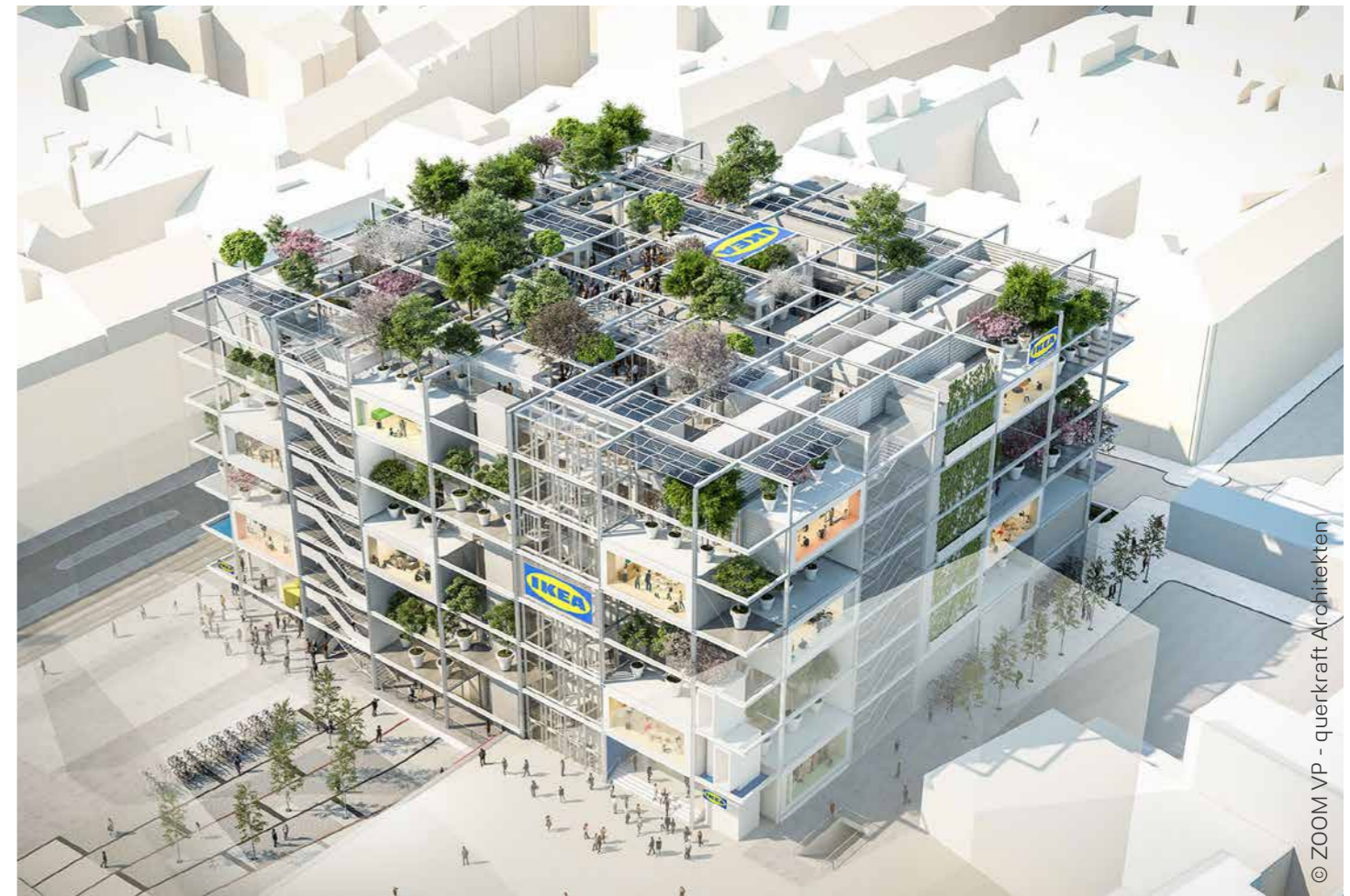
© ZOOM VP - querkraft Architekten