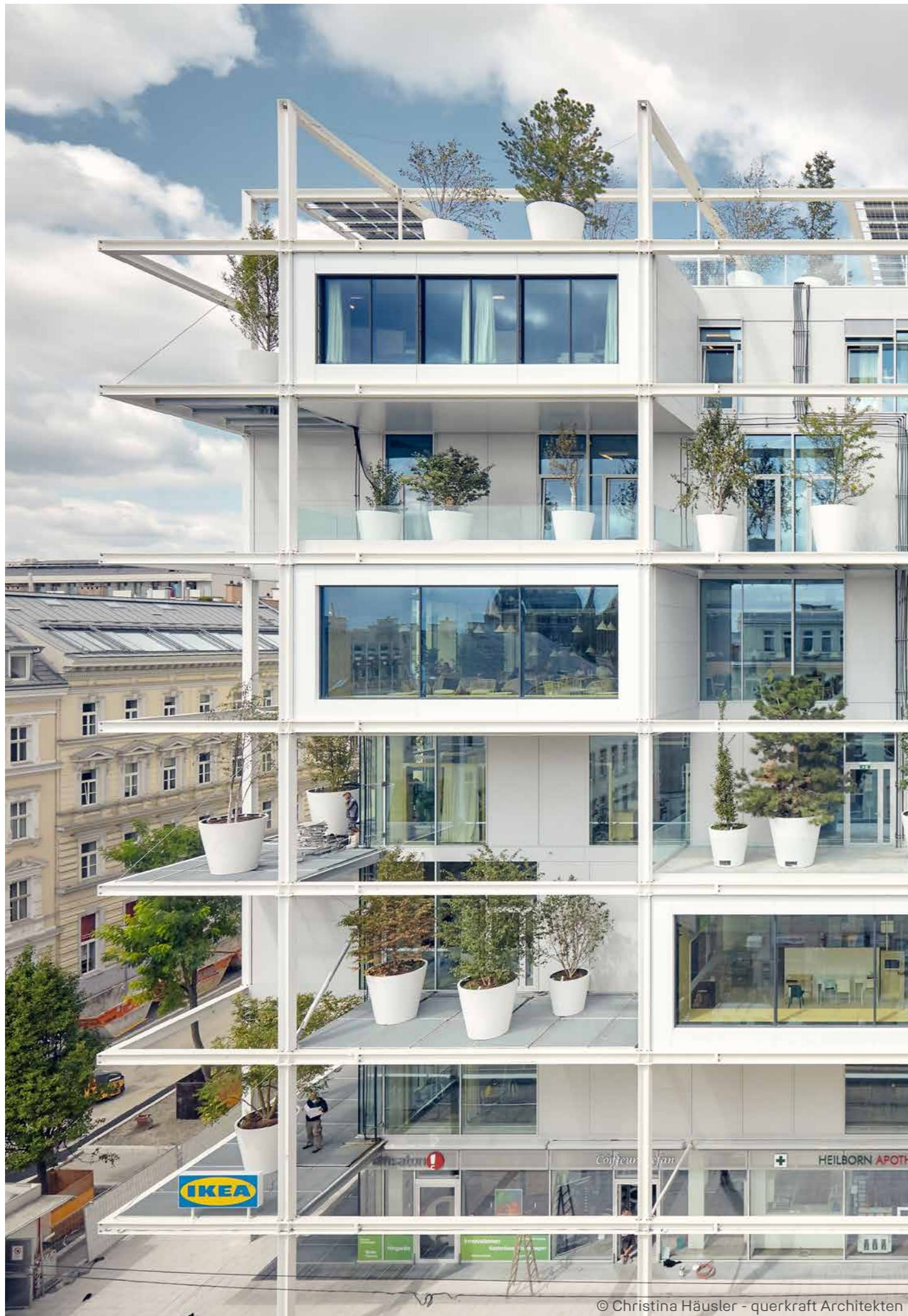
© Christina Häusler - querkraft Architekten